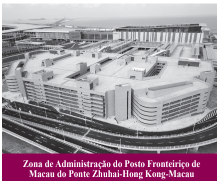
Zona de Administração do Posto Fronteiriço de Macau do Ponte Zhuhai-Hong Kong-Macau