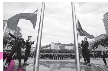
Grupo responsável pelo Hastear da Bandeira da Unidade Tática de Intervenção da Polícia a hastear as Bandeiras Nacional e Regional da RAEM, na Praça Flor de Lótus.