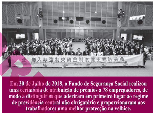
Em 30 de Julho de 2018, o Fundo de Segurança Social realizou uma cerimónia de atribuição de prémios a 78 empregadores, de modo a distinguir os que aderiram em primeiro lugar ao regime de previdência central não obrigatório e proporcionaram aos trabalhadores uma melhor protecção na velhice.