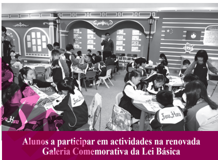
Alunos a participar em actividades na renovada Galeria Comemorativa da Lei Básica