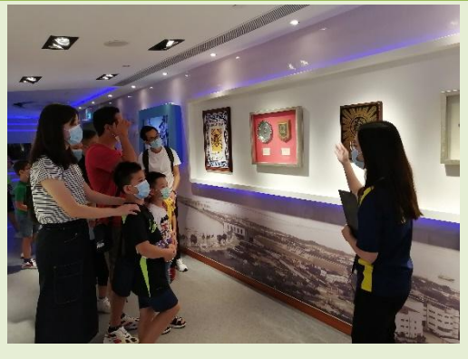
Actividade de Verão “Aula da PJ – Conhecer o trabalho policial”

Em Agosto de 2020, foram realizadas 4 sessões da actividade “Aula da PJ – Conhecer o trabalho policial (actividade de Verão)” com a colaboração da Direcção dos Serviços de Educação e Juventude. Participaram 56 encarregados de educação e os seus filhos nestas actividades, durante as quais se fizeram visitas às instalações da PJ, nomeadamente ao Núcleo de Denúncias e Intervenção, sala de exposição multimédia, carreira de tiro para treino simulado, sala de conferências de imprensa, equipamento nos veículos de patrulhamento, salas de inquirição e de interrogatório. Para além de ficarem a conhecer alguns equipamentos, os participantes puderam conhecer e entender melhor o organograma e o trabalho quotidiano da PJ, de modo a promover a interacção entre polícia e população e, ainda, para ter uma melhor ligação entre polícia e população.