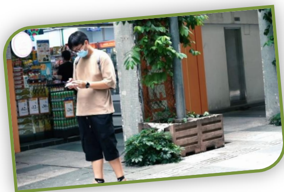
“Armadilha de compras de cartões de ponto para enjo kosai ”