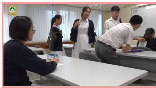
“ Bullying nas escolas”