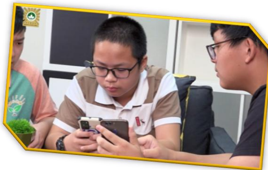
“Cuidado com a armadilha de pagamento de dinheiro real para o jogo”