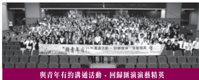
與青年有約溝通活動，回歸匯演演藝精英