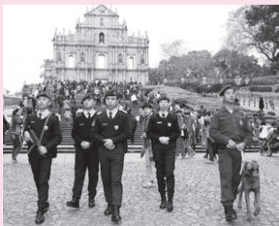
保安當局有效預防及打擊犯罪，確保市民和遊客安全，維護本澳社會穩定發展。