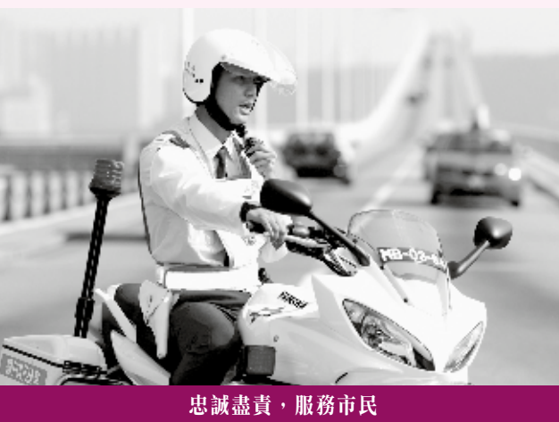
忠誠盡責，服務市民