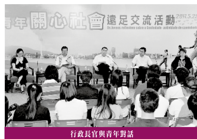
行政長官與青年對話