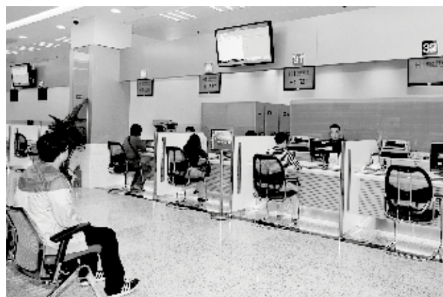
提升“政府綜合服務大樓”的效能，提供優質服務