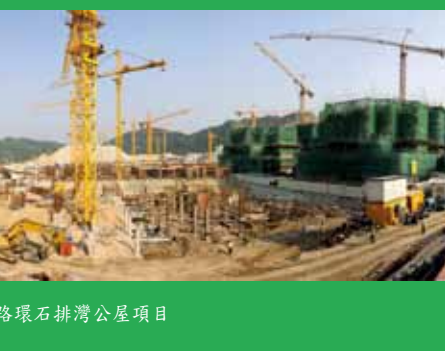
路環石排灣公屋項目