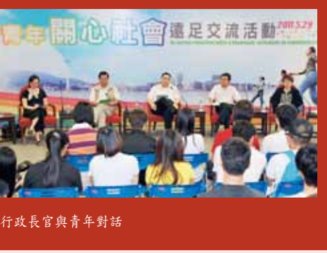
行政長官與青年對話