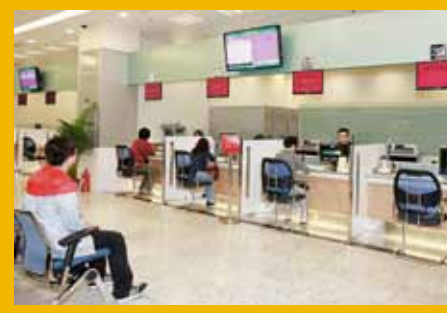
提升“政府綜合服務大樓”的效能，提供優質服務