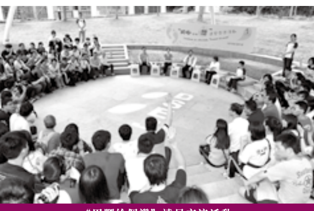
“用腳給個讚”遠足交流活動