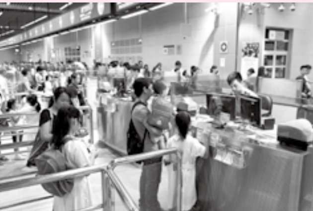
學童通關專用通道