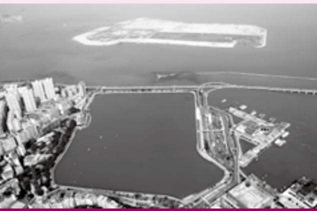
完善基建設施配套，打造宜居宜遊城市