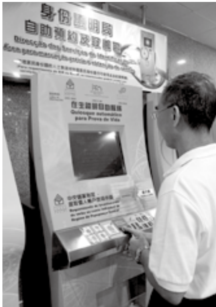
擴展人性化及便捷的跨部門自助服務