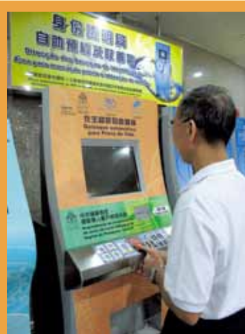
擴展人性化及便捷的跨部門自助服務