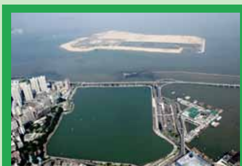
完善基礎設施配套，打造宜居宜遊城市