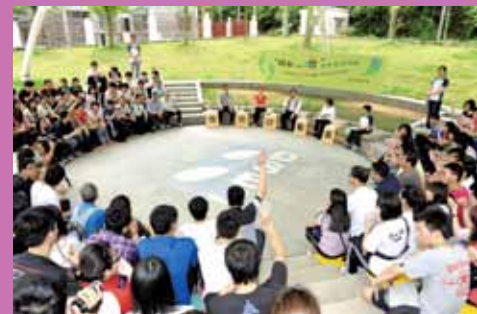
“用聊給個讚”遠足交流活動