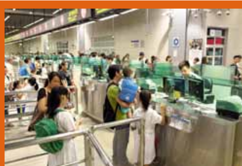
學童通關專用通道