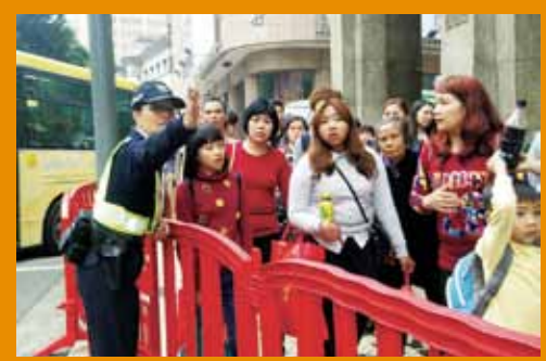
警方周密部署及作出清晰指示，維持本澳旅遊區的秩序。