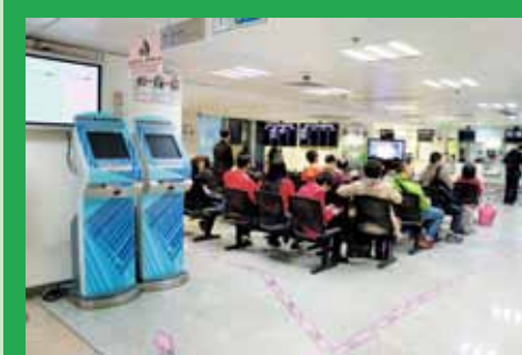
身份證明局領證大堂