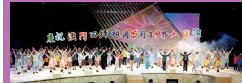
慶祝澳門特別行政區成立十五週年學界大匯演

本着高度的責任感和使命感，把“關顧弱勢社群，完善民生福利”放在首位，努力做到“察民情、納民意、知民需、解民憂、紓民困”，與廣大居民攜手奮進，共建幸福家園。