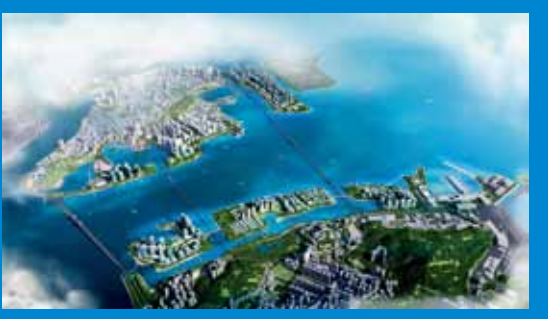
優化城市發展規劃，共創優質生活環境。