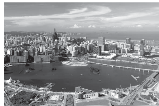
完善城區規劃，推動城市和諧發展