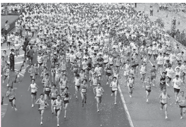
和諧社會，共建共享