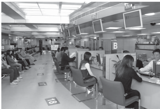
特區政府成立後致力為市民提供優質便捷服務