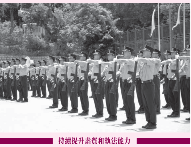
持續提升素質和執法能力