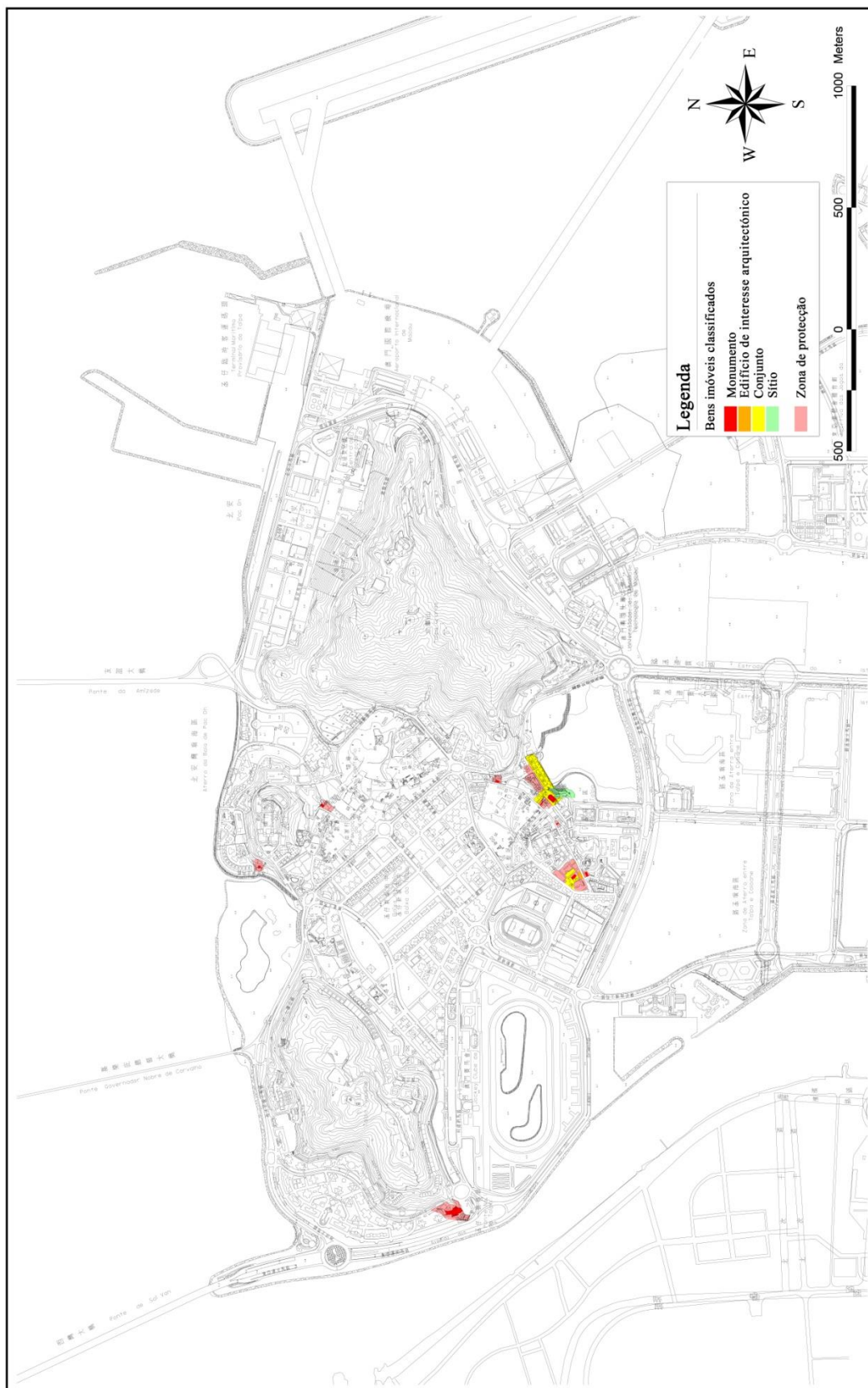
MAPA DE DELIMITAÇÃO GRÁFICA DOS BENS IMÓVEIS CLASSIFICADOS E DAS ZONAS DE PROTECÇÃO TAIPA

De acordo com as disposições do artigo 115.º e n.º 2 do artigo 117.º da Lei n.º 11/2013 (Lei de Salvaguarda do Património Cultural)